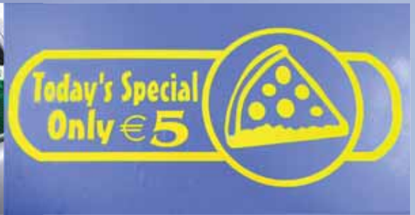
WERBUNG und vieles mehr...